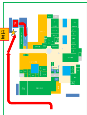
感染症患者対応 自家用車誘導ルート