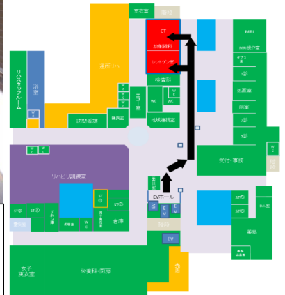
病棟 感染症疑い患者 検査誘導ルート